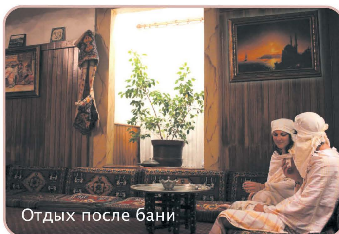
Отдых после бани