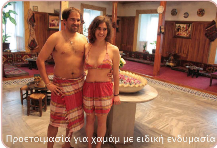
Προετοιμασία για χαμάμ με ειδική ενδυμασία