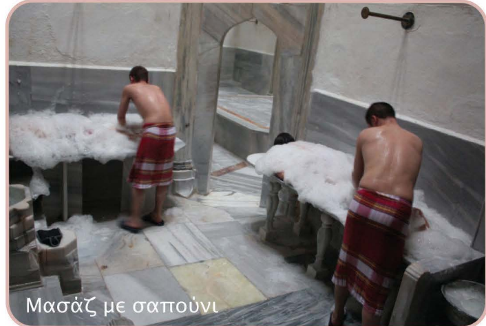
Μασάζ με σαπούνι